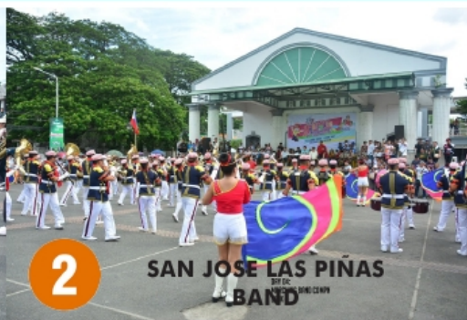
2 SAN JOSE LAS PIÑAS BAND