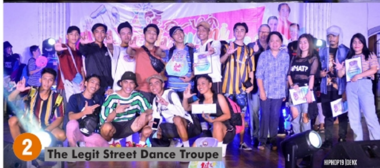
2 The Legit Street Dance Troupe