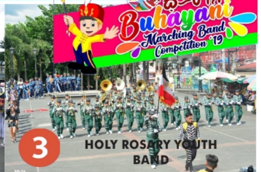
3 HOLY ROSARY YOUTH BAND