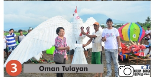
3 Oman Tulayan