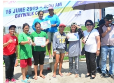
2 WOMAN ROWING