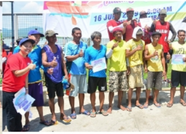
4 MAN ROWING