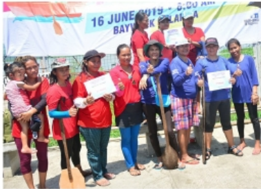
4 WOMAN ROWING