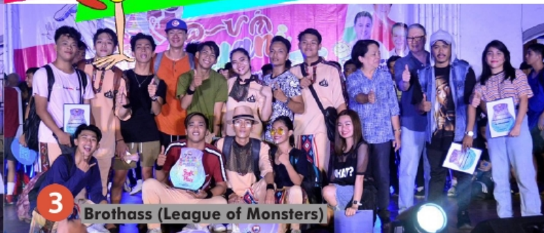
3 Brothass (League of Monsters)