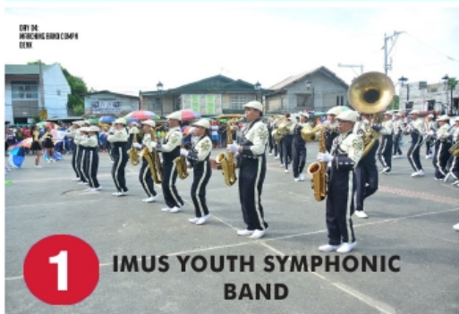
1 IMUS YOUTH SYMPHONIC BAND