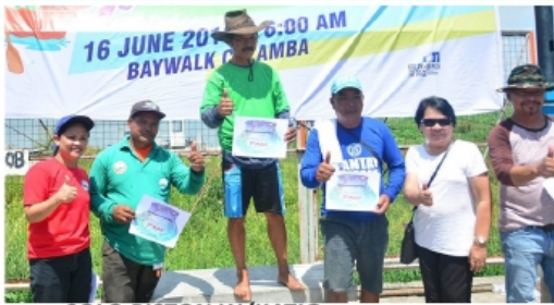
SOLO PISTON W/KATIG