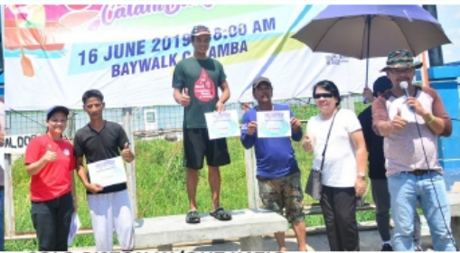
SOLO PISTON W/OUT KATIG