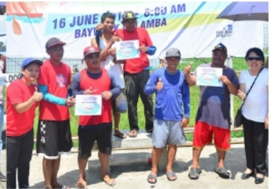
2 MAN ROWING